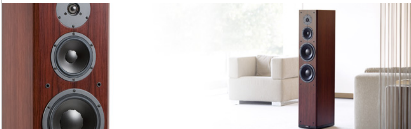
Домашние системы: Обзор колонок Focus 360 >