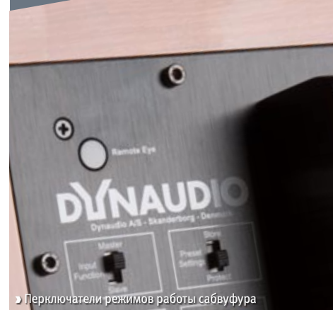
► Переключатели режимов работы сабвуфера