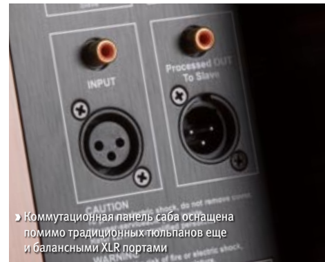
► Коммутационная панель саба оснащена помимо традиционных тюльпанов еще и балансными XLR портами